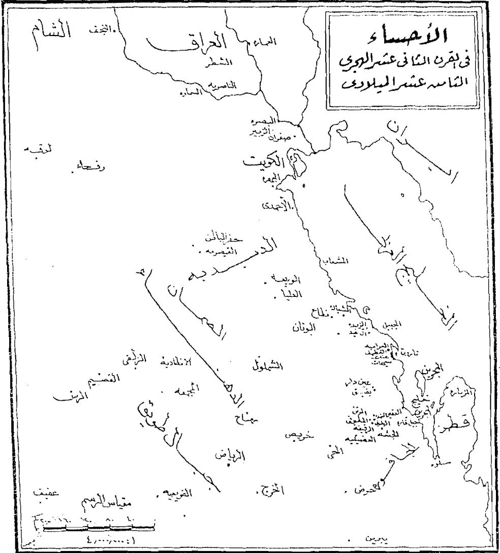
طغق رقص (١١)